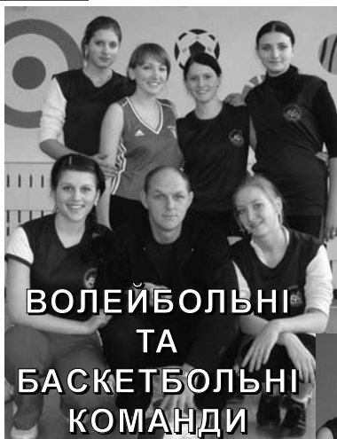
ВОЛЕЙБОЛЬНАЯ БАСКЕТБОЛЬНАЯ КОМАНДА ГИМНАЗИИ